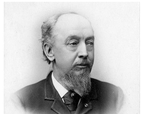
William le Baron Jenney