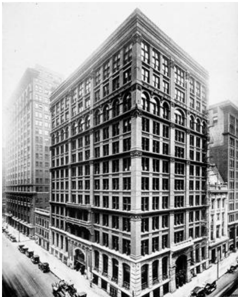
Home Insurance Building Chicago 1885