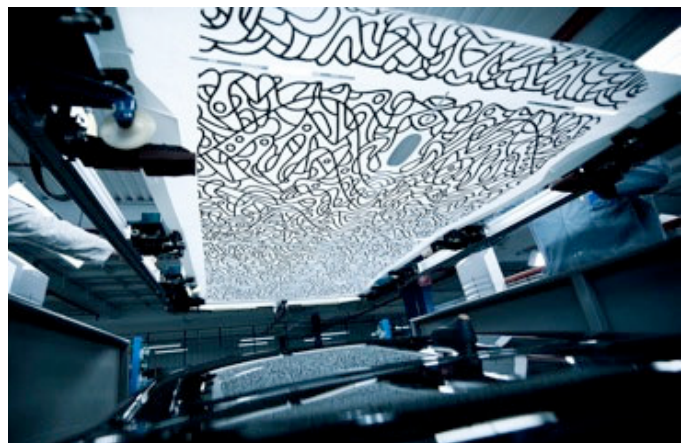
Atelier de personnalisation DS3