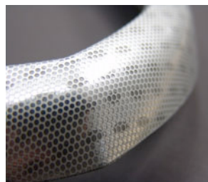
Composant pour insert molding