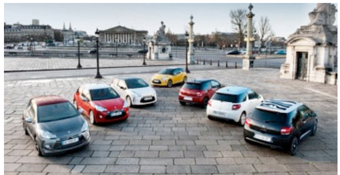
Personnalisation gamme DS2 Citroën